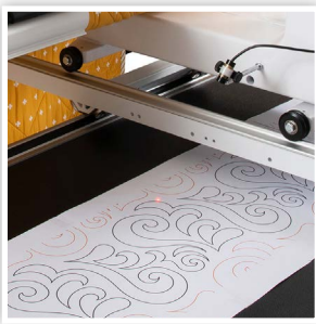
OPTIONNEL: POINT LASER POUR LE PIQUAGE AU PANTOTGRAPHE