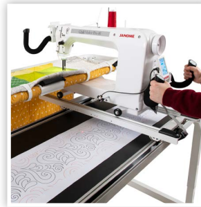
GUIDONS AVANT ET ARRIÈRE AJUSTABLES *