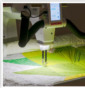
ANNEAU D'ÉCLAIRAGE LUMINEUX AU-DESSUS DE L'AIGUILLE