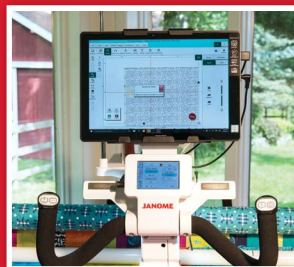
Pro-Stitcher sur la QMPro18