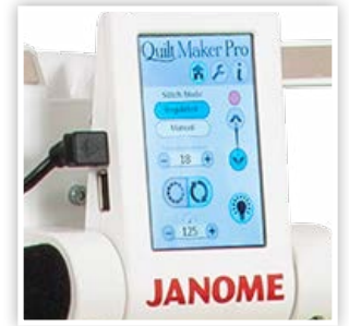
ÉCRAN TACTILE NUMÉRIQUE LCD