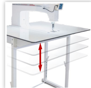
DEBOUT OU ASSIS: HAUTEUR RÉGLABLE DE LA TABLE