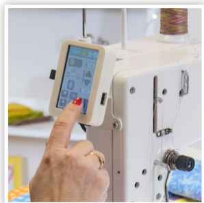
ÉCRAN TACTILE LCD NUMÉRIQUE