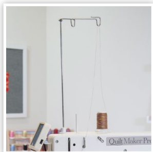
SUPPORT À FILS TÉLÉSCOPIQUE INTÉGRÉ