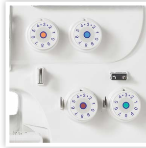
GUIDES-FILS CODÉS EN COULEUR