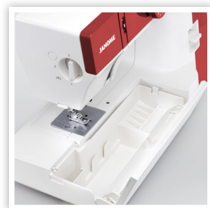
GRANDE OUVERTURE DU COMPARTIMENT DE RANGEMENT