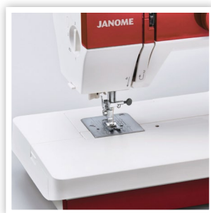
SURFACE DE COUTURE EXTRA LARGE