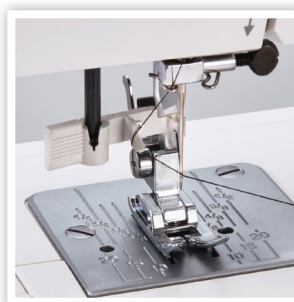
ENFILEUR D'AIGUILLE INTÉGRÉ