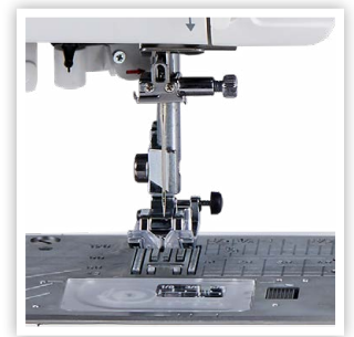
SYSTÈME D'ENTRAÎNEMENT SUPÉRIEUR PLUS (SFS+) AVEC GRIFFE EN 7 PIÈCES