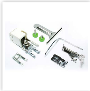
ENSEMBLE DE PIQUAGE INCLUS