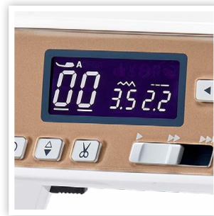
ÉCRAN LCD AVEC TOUCHES DE NAVIGATION