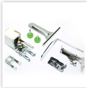
ENSEMBLE DE PIQUAGE INCLUS