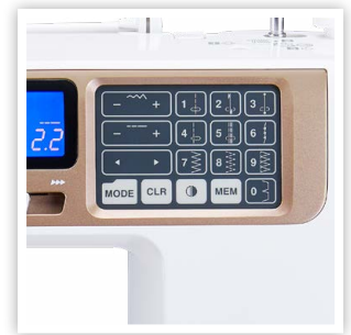
PLUSIEURS CARACTÉRISTIQUES PRATIQUES