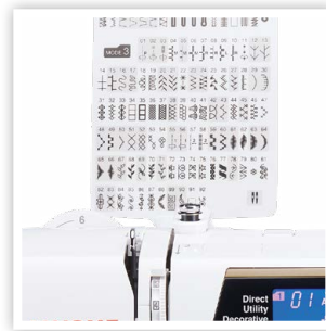
TABLEAU DÉTACHABLE DES POINTS