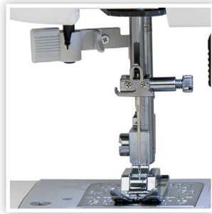
ENFILEUR FACILE INTÉGRÉ