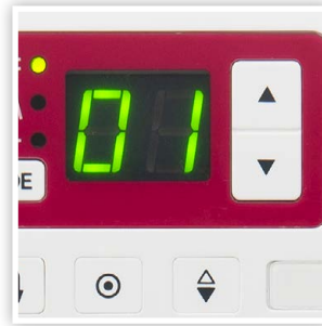
ÉCRAN DEL AVEC TOUCHES FACILES DE NAVIGATION