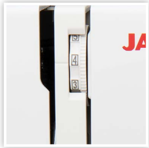
TENSION DU FIL RÉGLABLE