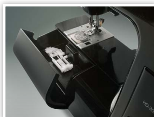
COFFRET PRATIQUE POUR RANGEMENT