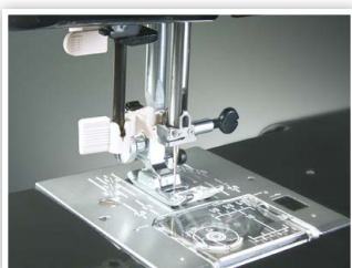
ENFILEUR D'AIGUILLE ET DÉPÔT DE LA BOBINE EN SURFACE