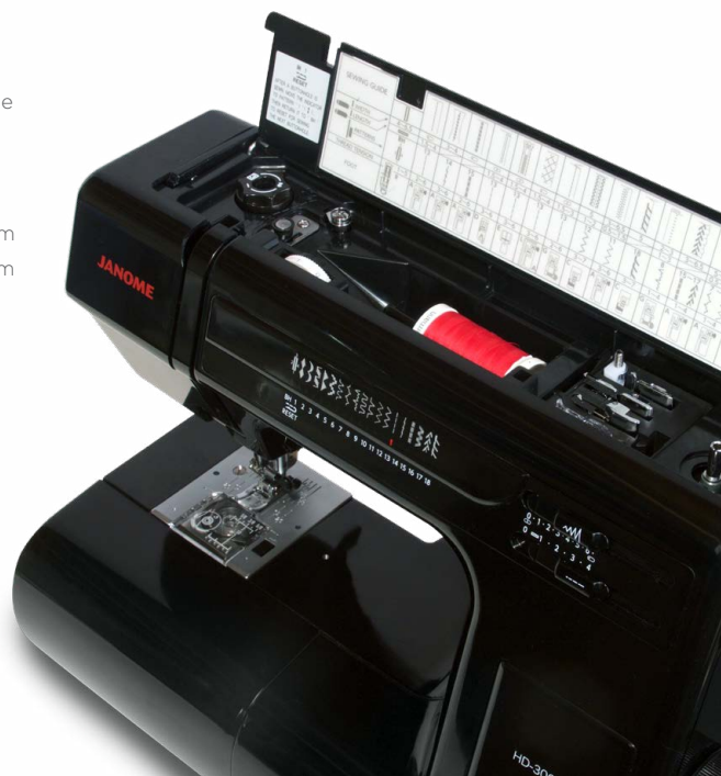
PRATIQUE COFFRET DE RANGEMENT DES ACCESSOIRES ET TABLEAU DE RÉFÉRENCE