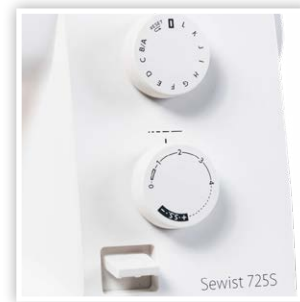
PRACTIQUES BOUTONS DE CONTRÔLE DES POINTS