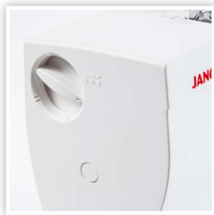
ACCÈS FACILE AU CADRAN DE PRESSION DU PIED