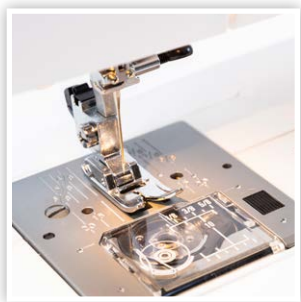
PLAQUE D'AIGUILLE BREVETÉE AVEC MARQUAGE