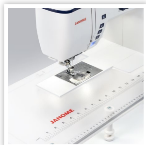
TABLE DE RALLONGE INCLUDE