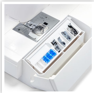
BRAS LIBRE, RANGEMENT POUR ACCESSOIRES