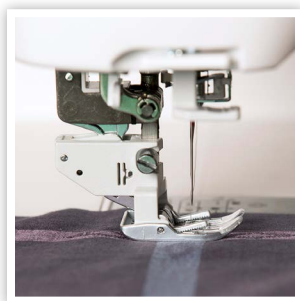
SYSTÈME D'ALIMENTATION DES TISSUS ACUFEED FLEX