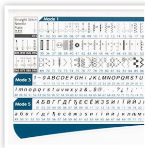
196 POINTS INTÉGRÉS INCLUANT 10 BOUTONNIÈRES