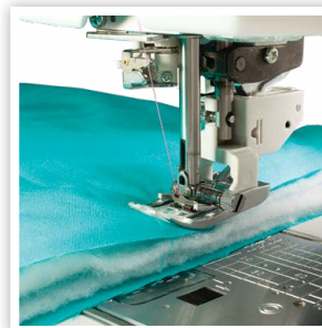
SYSTÈME D'ENTRAÎNEMENT DE TISSU MULTICOUCHE ACUFEED FLEX