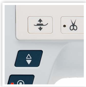
RELÈVEMENT AUTOMATIQUE DU PIED PRESSEUR