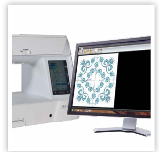
PROGRAMME CRÉATEUR DE POINTS STITCH COMPOSER POUR CLÉ USB