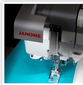
VISIBILITÉ AMÉLIORÉE, LUMIÈRE RÉTRACTABLE