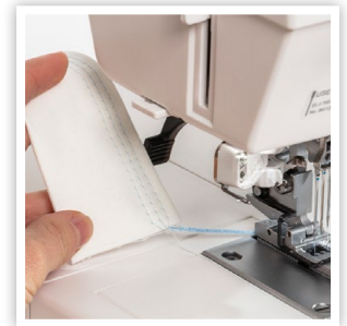
CHAÎNETTE D'ARRÊT À LA FIN DE LA COUTURE