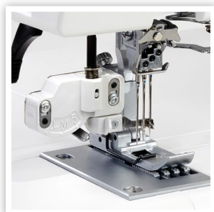
ENFILEUR D'AIGUILLE À 3 POSITIONS