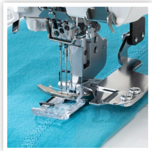
UNE PREMIÈRE DANS L'INDUSTRIE, POINT DE RECOUVREMENT INTÉGRÉ